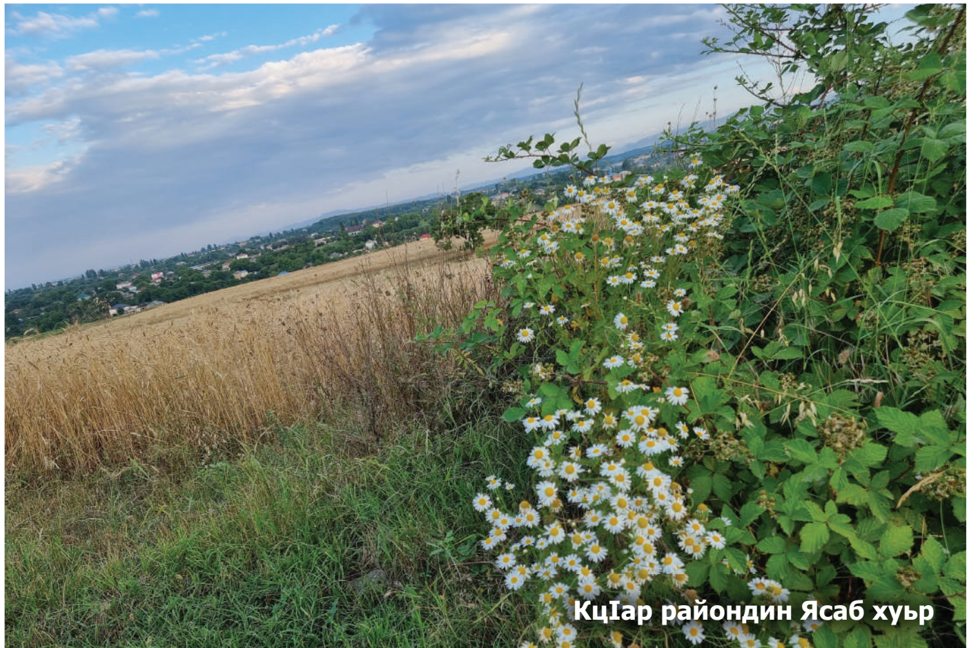
КцӀар райондин Ясаб хуьр

Чилер къурагъвиликай хуьн паталди датӀана цин игътиятар артухариз, яд къацӀур тавуна хуьз, гъакӀни накъвадин эрозиядин вилик пад къаз алахъна кӀанзава.