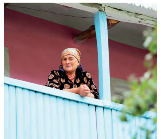
«Самур» газетдин рехъ вилив хуьзва