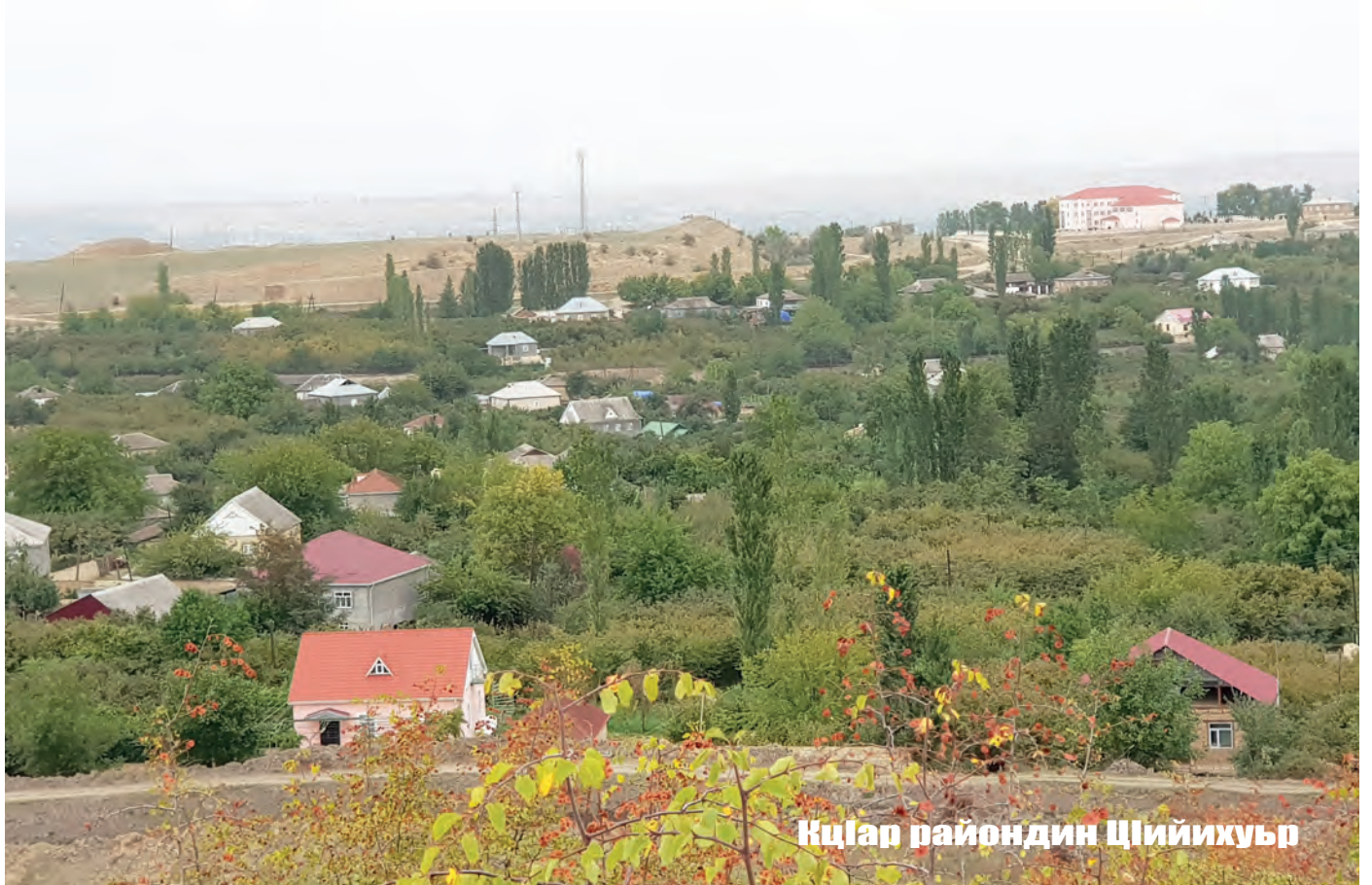
Кцлар райондин Цийихуър