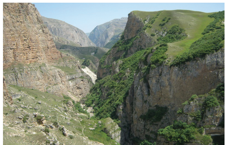
Qubanın Qudyalçay vadisi