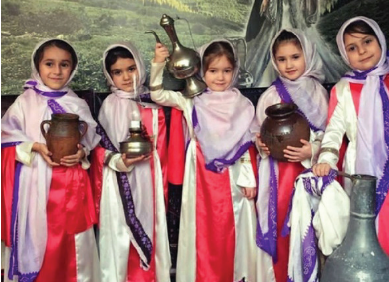
Дагъустандин Мегъарамдхуьруьн райондин аялар