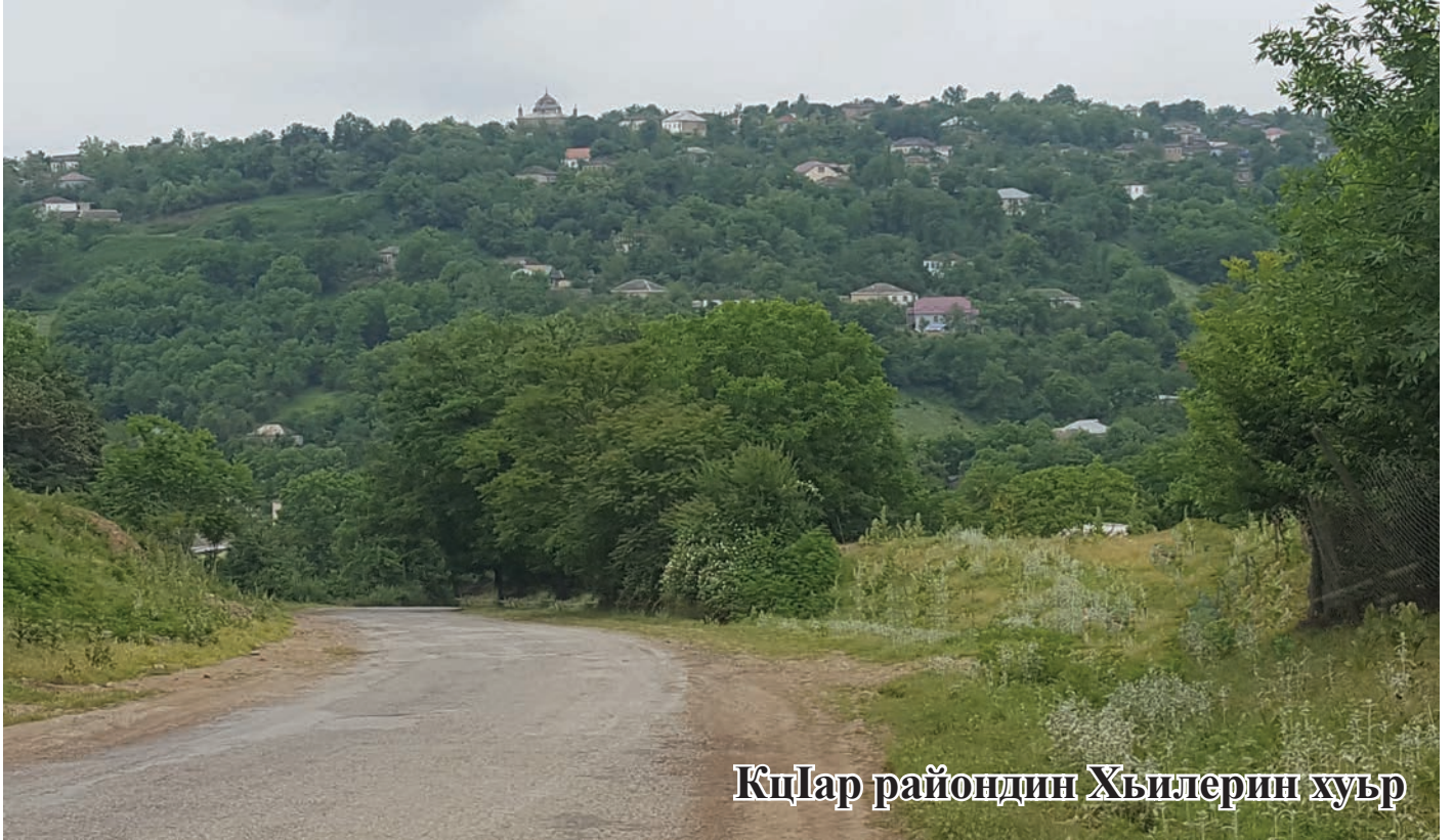
Кълар райондин Хъилерин хуьр

Идалай гьейри зенг ягъазвай чкадин къурулушни чирнава. Адан кеферпатан ва къиблепатан цлариз муьква тир къве къул винел акъатнава. Абуру инаг къадим яшайишдин макан тирди субутзава. 300 квадратметрдин майданда тухузвай крар давамарзава ва виликай къвезмай йисуз албан килисадин муькув хъайи яшайишдин макан гегъеншидиз чирун къарардиз къачунва.