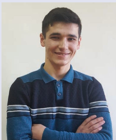
Жангъудиз физ-хтана вун. Анаг гена са акъван яргъа тушир. Гила 3 йисузни Сумагъаллыдин рекъе жедани? Инай аниз 8 километр я. Гъар юкъуз 16 километрдин

Жегъилвилин къадир хъайитIа, уьмуьрни мет-леблуди жада.