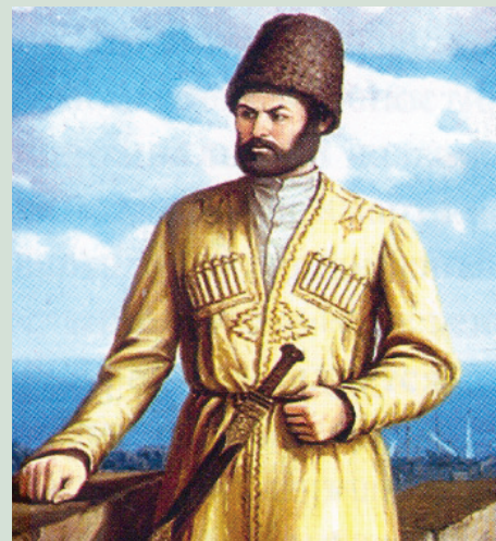
Йиф элквейла, ракъинин нурлу экверихъ. Жагъурзамач манирин иер чешмеяр, Шаир инжи алумдай чура уьлчмеяр.»

къайгъусузвилай, Даимвал фикирда яхъ сифте къилай. Лавгъавалда цекверени вичин жуьреда, Аватлани рикле гъам, зи чин хуьреда. Вуч лугъун къван? Жува-жуе къвадарнава за, Зи нитрин хуьтуьлвални гадарнава за. Хуьтуьлвални, тазавалии жеда цукъверихъ,