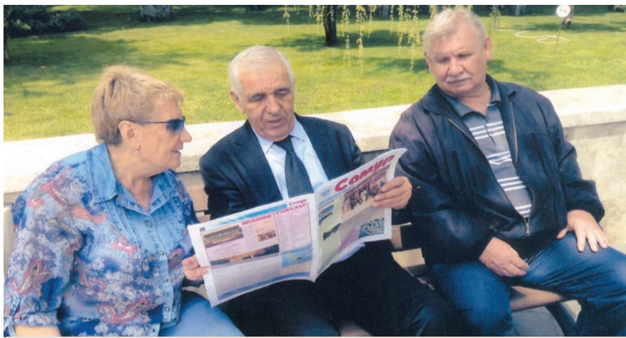
«Самур» газетдин дуст Мамедагъа Сардарова яргъарай атай мугъманриз дидед члалал акъатзавай газетдикай чирвилер гузва.