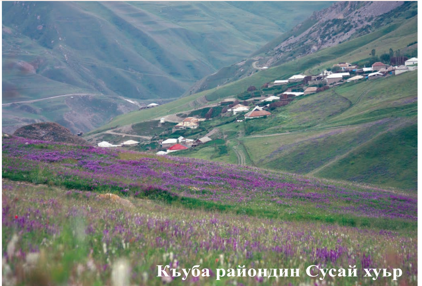
Къуба райондин Сусай хуьр