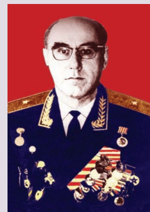
Генерал-майор Мегьамедгьанифа Шайдаев

Хуьруьнбуру лугьзувайвал, Шайдаевриз Цмур шегьердиз элкьуьриз кланзава. Вилик йисара и хизанди чпин пулуни такьатралди хуьре спортдин меркез, Гьалибевлин музей, хуьруьн кламал муьгь эцигна, хуьруьн куьчейра кьир туна, иниз хьвадай яд гьана ва маса