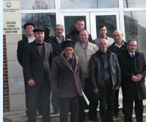
Кичан хуьруьн юкъван мектебдин муаллимар