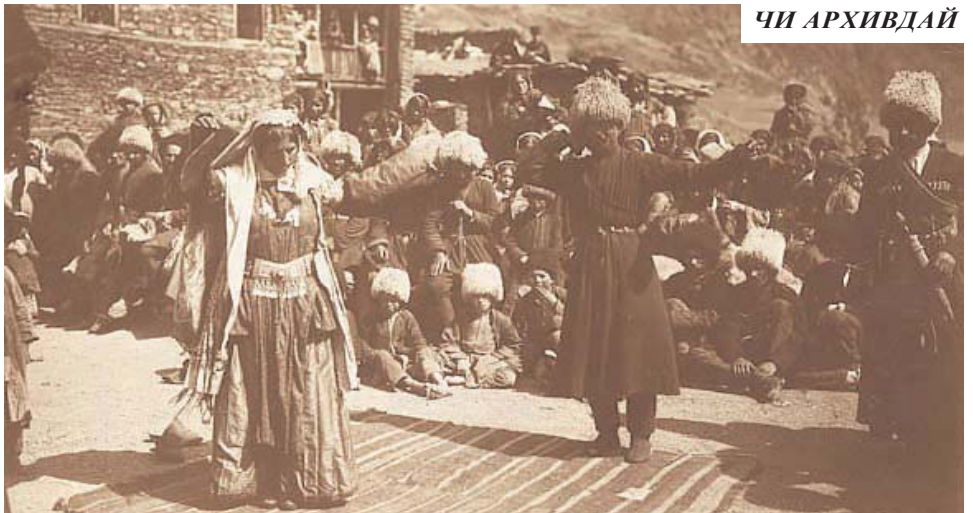
Лезгинка кьул. Лезгияр. Дагъустан вилайат. XX виш йисан эвлар.