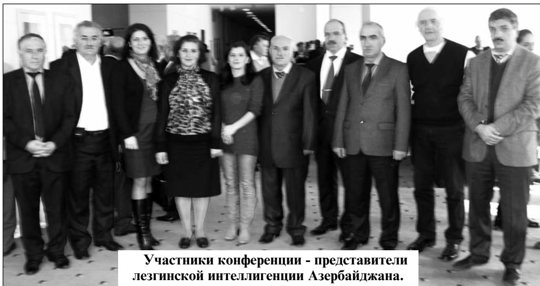
Участники конференции - представители лезгинской интеллигенции Азербайджана.