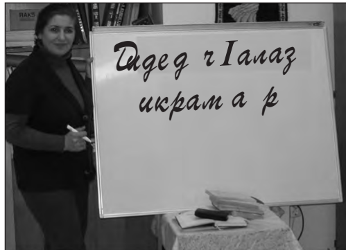
"Самур" газетдин редакцияди 2010-йис дидед чIалан иш хъиз къейд авун къарардиз къачунва. Гъавилий ина са къадар теббирар къиле тухуда. А теббиррикай садни дидед чIалан тарсар тухун я. И мукъвара редакцияда сад лагъай тарс къиле фена.