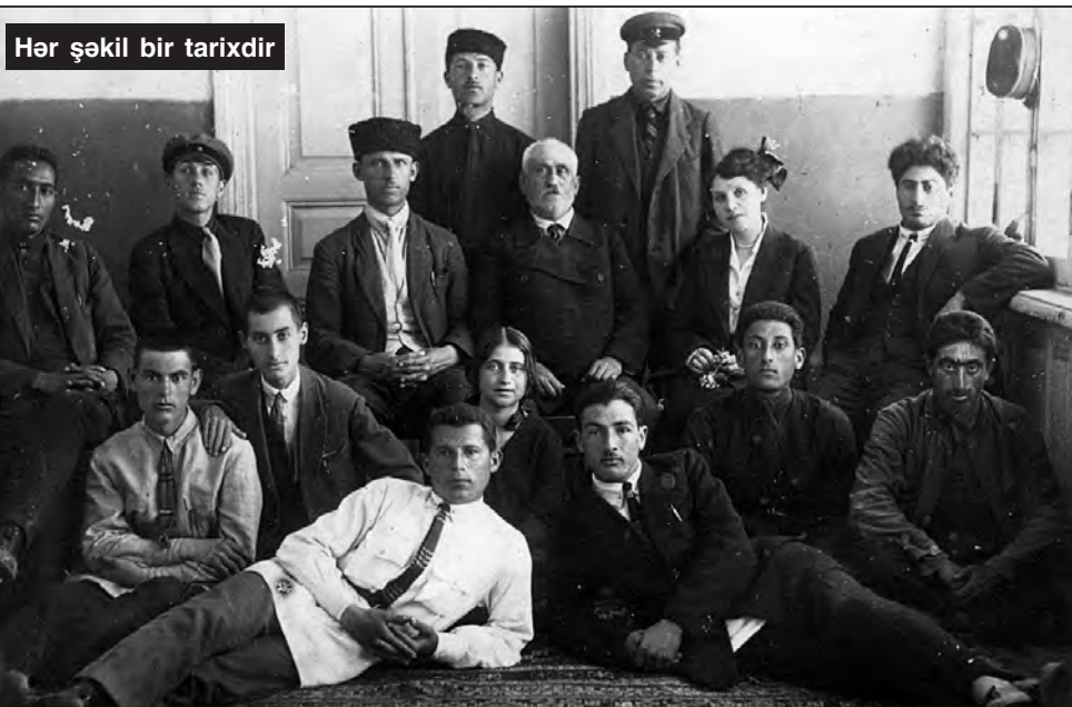
Hər şəkil bir tarixdir

Qusar şəhərinin yaxınlığında yerləşən Köhnə Xudat kəndində özəlləşdirilmiş 15 sot torpaq sahəsi satılır. Bar verən meyvə bağı var. Qiyməti 15 min manatdır.