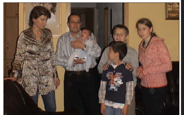
АКИФ С СЕМЬЕЙ