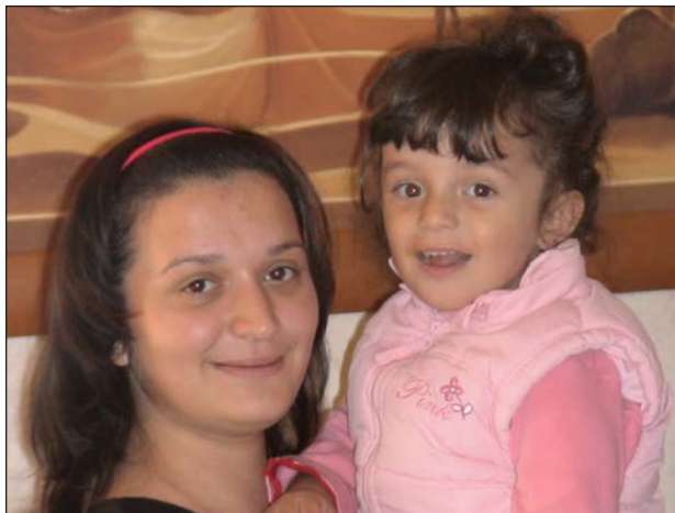
НИЯР И ТАМАМАТ