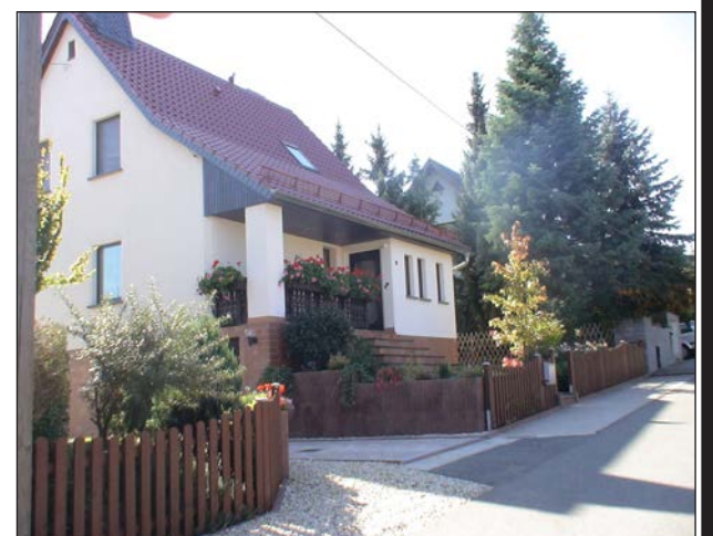
ДОМ В ДЕРЕВНЕ