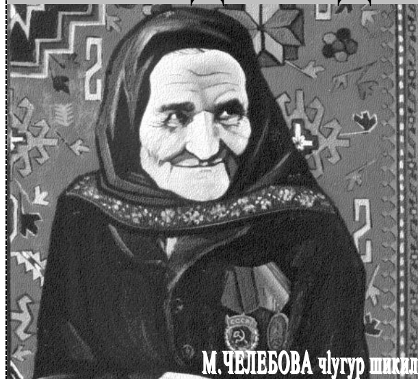
М.ЧЕЛБОВА чІугур шикил

Зибейда Шейдаева 1860-йисан 1-апрелдиз КІлар райондин Хъилерин хуьре диледиз хъана. Ада халичаар хран вичин диде Первиназавай чирнай. 106 йис яшамеш хъайи Первиназа 40-далай виниз чешнеяр храдай. Сифте яз "Сафар" чешнеяр ада арадал гъанай. Исъятда Куьре пата и чешнедин 3 жуьре ама.